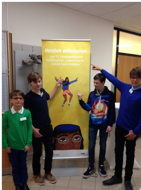
Die vier IGS-Schüler aus drei Jahrgängen

Drei Projekte von vier Schülern der Georg-Christoph-Lichtenberg Gesamtschule (IGS Geismar) hatten sich beim Regionalwettbewerb von „Jugend forscht/Schüler experimentieren“ in Braunschweig in den Kategorien Biologie, Geo- und Raumwissenschaften und Physik für die Teilnahme am Landeswettbewerb in Oldenburg vom 5. bis 7.4.18 qualifiziert.